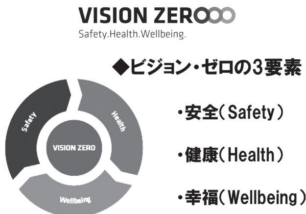
図3 ビジョン・ゼロの3要素