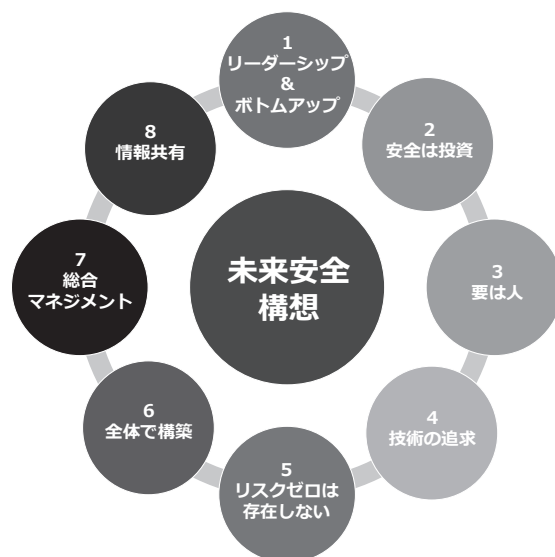
図1 未来安全構想 2)

て、2016年7月にセーフティグローバル推進機構 (IGSAP) 1) が設立された。IGSAPは、ものづくりの世界はもちろんのこと、非製造業を含めて幅広い業界・業種における施設・設備の安全化や働き方改革の重要性を主張し、かつ安全化に対する幅広いニーズに応じて活動することを当面の目的としていた。筆者が、ビジョン・ゼロ活動に出会うきっかけとなったのは、IGSAPが、2017年6月に日経BP総研と共同して、今後の広い分野の安全の在り方を「未来安全構想」 2) としてまとめて、公表したことによる。未来安全構想の狙いは、現在、ICT技術の発展によって私たちの社会は世界的な潮流である第四次産業革命にともなって高度化しつつあり、わが国でも Society 5.0 にむけて社会の変革や働き方改革も含めて未来社会を創り上げようとしているが、その礎として、まず安全を構築していくことが大前提であると